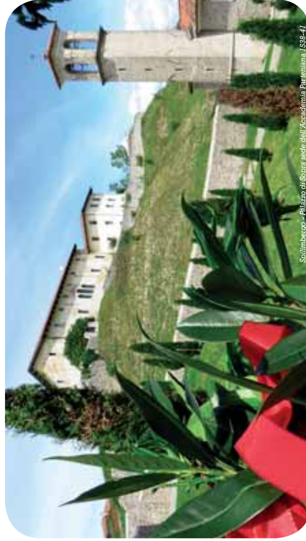
Spilimbergo - Palazzo di Sopra sede dell'Accademia Parentiana 1538-41